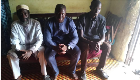
Presentatie project aan dorpschef (L)

Ondertussen werd ook de bewustmakingscampagne verder uitgerold. Zo werd het project aan de chef van het dorp gepresenteerd en worden de wijkcoördinatoren over het project en hun stimulerende rol daarin geïnformeerd.