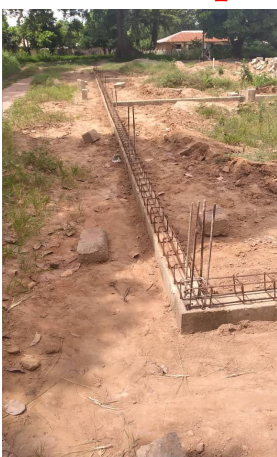
Weer een klein stapje verder