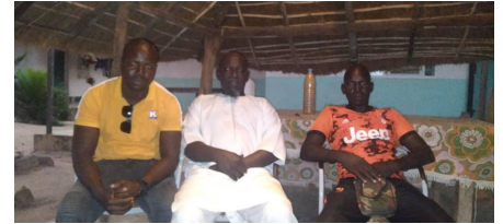
Bezoek aan wijk Bantang Wooro

In de komende werken worden de afvalbakken en de driewielmotorfiets voor het verzamelen en ophalen van het plastic afval en de materialen voor het maken van de bouwmaterialen aangeschaft, zodanig dat alles begin 2022 voorhanden is voor de start van de inzameling.