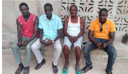
Bezoek aan wijk Bayasse